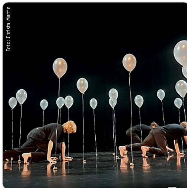
Abb. 1: Tanzprojekt Montessori-Schule Neubiberg

Nicht OBWOHL große Unterrichtszeiten gänzlich anders gestaltet werden, erreicht man ein gutes soziales, fachliches und kreatives Niveau in einer gemischten Schulgemeinschaft, sondern WEIL so verlässlich anders und temporär mit außerschulischen Expert/innen zusammengearbeitet wird, kann das Lernklima insgesamt gleichermaßen freundlicher und leistungsorientierter werden. Und es waren nicht nur unsere Schulen, die genau diese Erfahrung machten. Viele Schulen aus unterschiedlichen Netzwerken, besonders aus dem Kreis der Schulpreisschulen, der Blick-über-den-Zaun-Schulen, der Gemeinnützigen Gesellschaft Gesamtschulen (GGG) und weiterer Schulnetzwerke, die sich aus alten Formen befreien, teilen diese Erfahrungen. Aus tiefer Überzeugung für den Wert und den Ertrag von Projektarbeit hat z.B. die Max-Brauer-Schule in Hamburg die Fächerstruktur aufgelöst und einen großen zeitlichen Anteil stattdessen der Projektarbeit eingeräumt: handlungsorientiert, fächerübergreifend und immer mit Präsentationen verbunden, die den Schüler/innen „Selbst-Wirksamkeit“ ermöglichen.